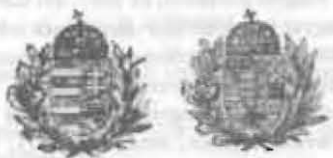
Az ún. „ívelt koszorús” címerrajzok

A magyar nyelvűeken a kiscímer, a magyar–horvát nyelvűeken és az 1933. évi kiadáson az egyesített címer látható. Az 1918. évi a köztársasági címerrel, az 1934. évi kiadás címer nélkül készült.